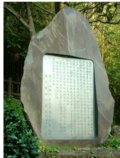
創立80周年にあたり、磨崖碑全文を新しい石に刻み後世に残すことにした。